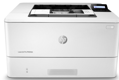
HP LaserJet Pro M404dn

Dynamic-Security-fähiger Drucker. Ausschließlich für die Verwendung mit Patronen mit Original HP Chip vorgesehen. Patronen mit Chips anderer Hersteller funktionieren möglicherweise nicht oder in Zukunft nicht mehr. Weitere Informationen unter: